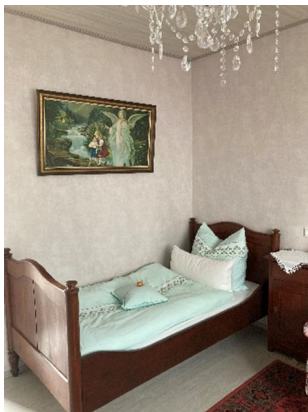
Wohn- u. Schlafbereich

Vor dem App. befindet sich ein eigener Stellplatz. Es hat einen separat zugänglichen Eingang auf der Rückseite des Gebäudes.