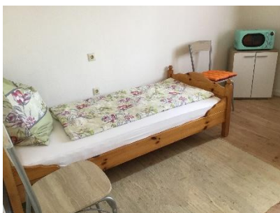
Wohn- u. Schlafbereich