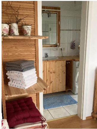
Bad mit Dusche, Waschmaschine, sep. WC