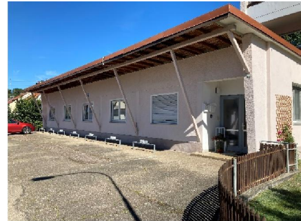
Vorderansicht Heiderfeldstraße >

In allen Wohnungen sind Bettwäsche, Hand- u. Geschirrtücher, Toilettenartikel, Fön, inklusive. Bei Bedarf kann ein Kinderbett zur Verfügung gestellt werden.