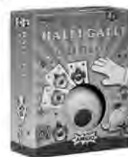
Amigo Halli Galli Junior (ab 4 Jahre)