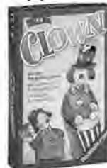
Ravensburger Clown (ab 4 Jahre)