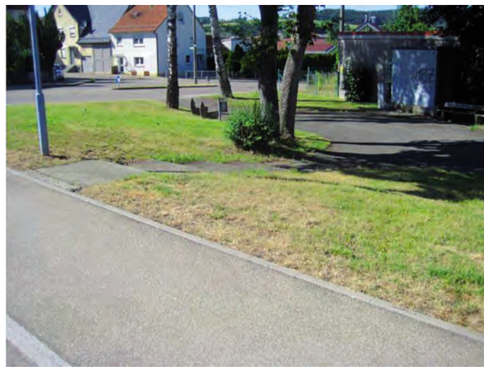
Platz am ehemaligen Schneckeweier