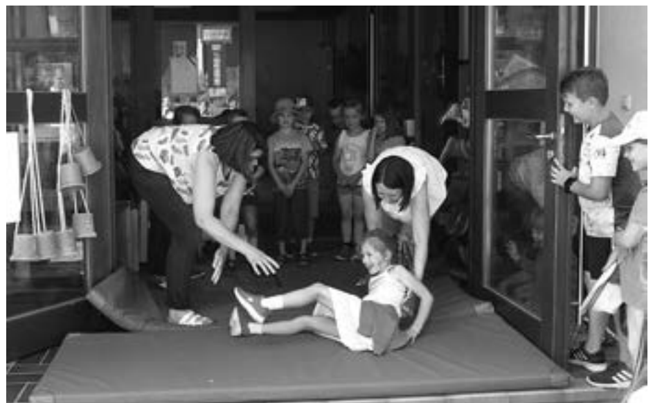
Lustiger Abschluss: Rauswurf der »Großen«