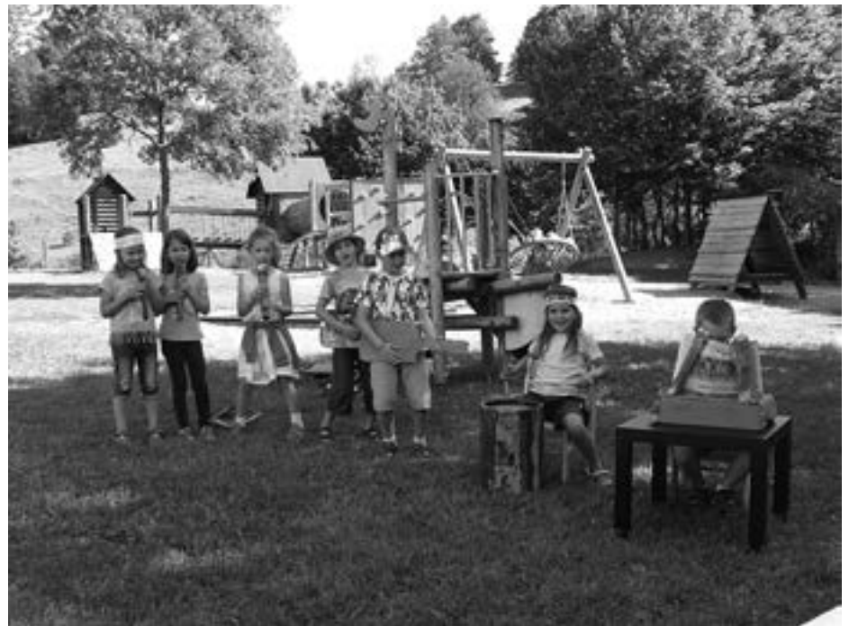
Die Rockstars haben ihren großen Auftritt