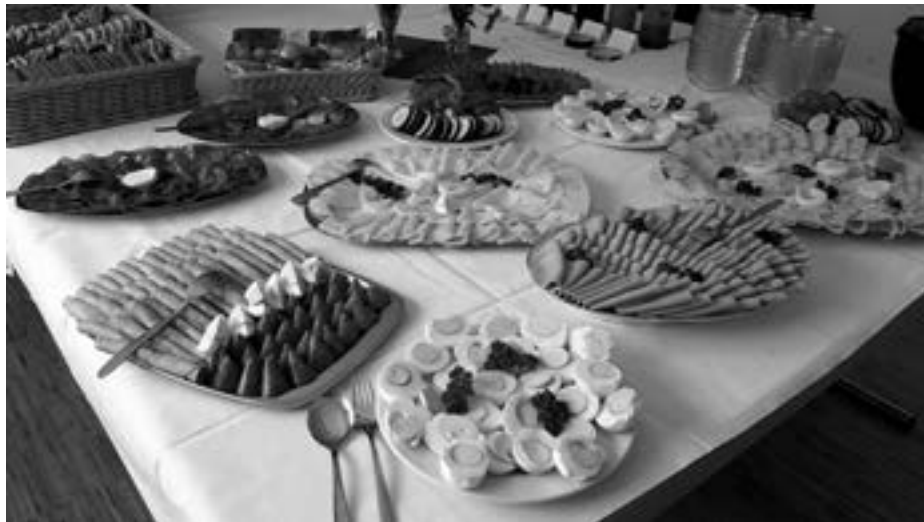
Die Teilnehmerinnen konnten sich an einem reichhaltigen Frühstück erfreuen.